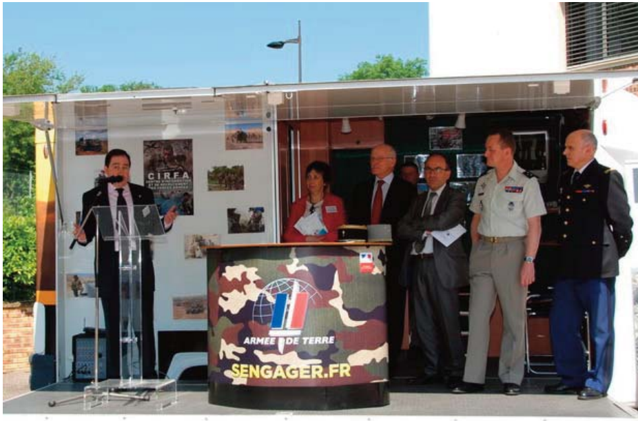
Allocutions d'ouverture du salon