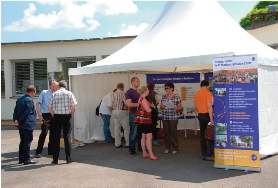
Stand de l'institut régional d'administration