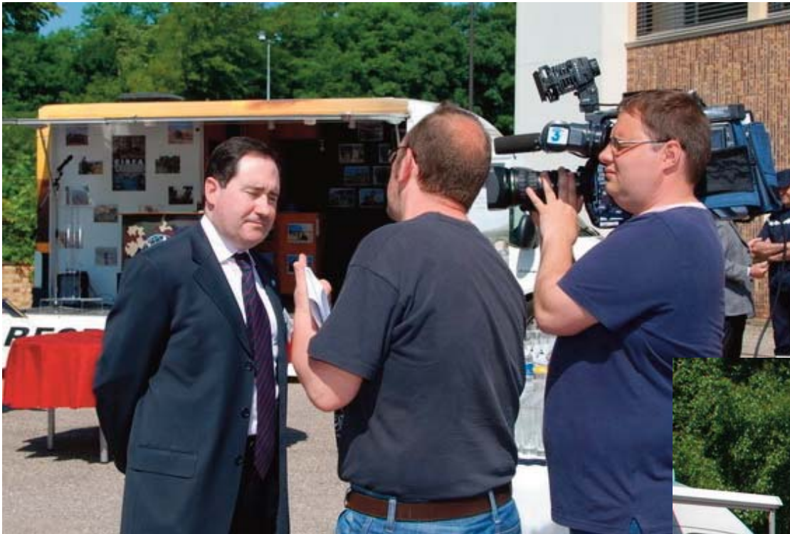
Interview France3 Lorraine