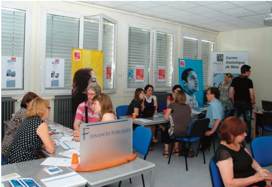
Stands de la direction régionale des finances publiques, de la caisse des dépôts et consignations et de l'INSEE