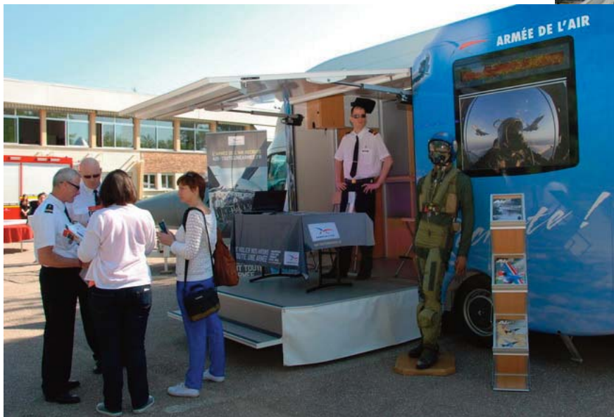
Sur le stand de l'armée de l'air