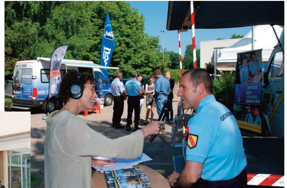
Interview France Bleu Lorraine