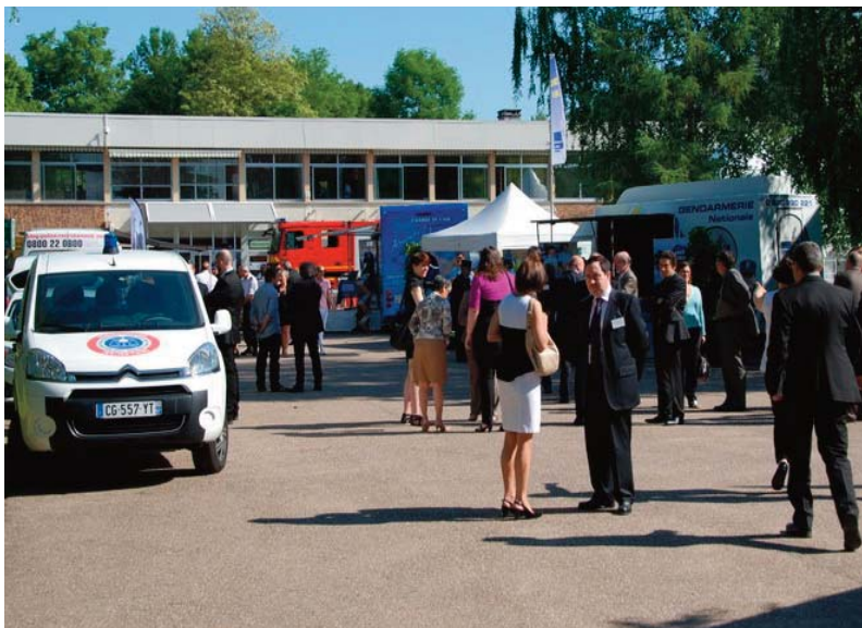
Ouverture du salon

700 métiers pour représenter les trois fonctions publiques, plus de 1 200 visiteurs en deux jours : le 1er salon de l'emploi et des métiers de la fonction publique organisé par l'IRA de Metz, les 7 et 8 juin 2013, a tenu ses promesses.