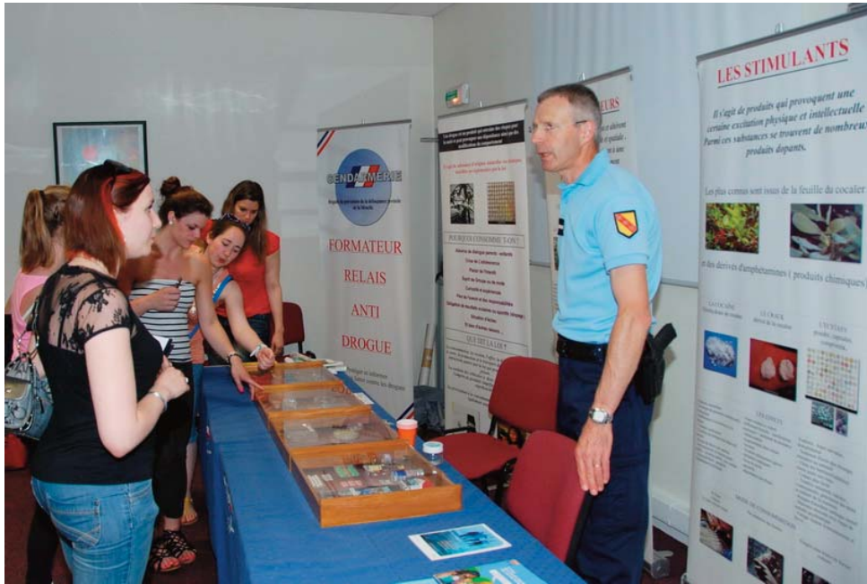
Sur le stand de la gendarmerie nationale, brigade de prévention de la délinquance juvénile de la Moselle