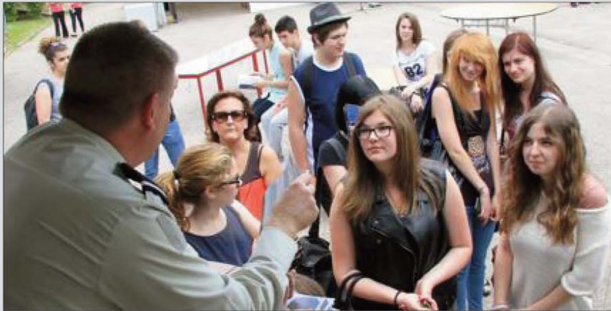
Sur le pôle de recrutement de l'Armée de terre, le public est nombreux depuis hier matin.