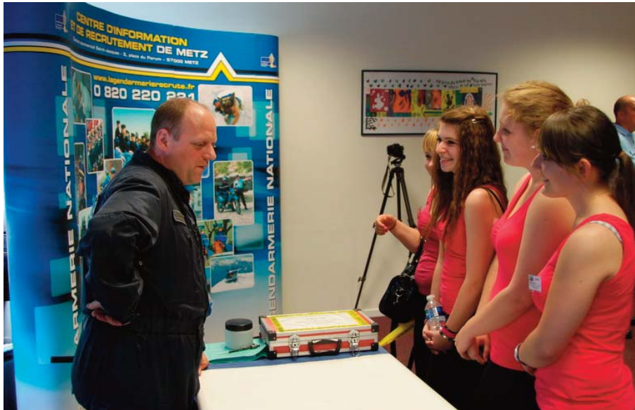
Sur le stand des techniciens en identification criminelle de la gendarmerie nationale