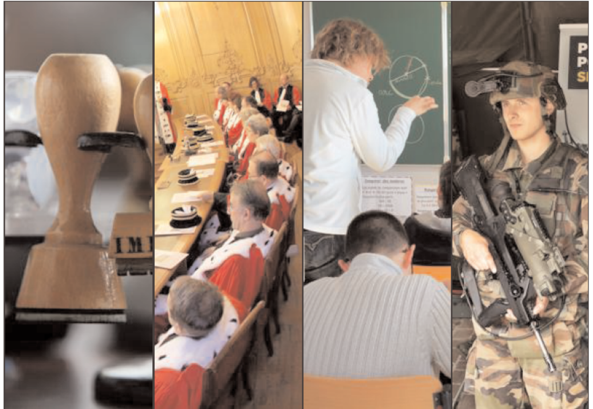
L'Ira a voulu montrer toute la diversité de l'emploi public dans ce salon.

Salon de l'emploi et des métiers de la fonction publique « Les jeunes et le service public », vendredi et samedi, de 9 h à 18 h, à l'Ira de Metz, 15 avenue de Lyon. Entrée libre.