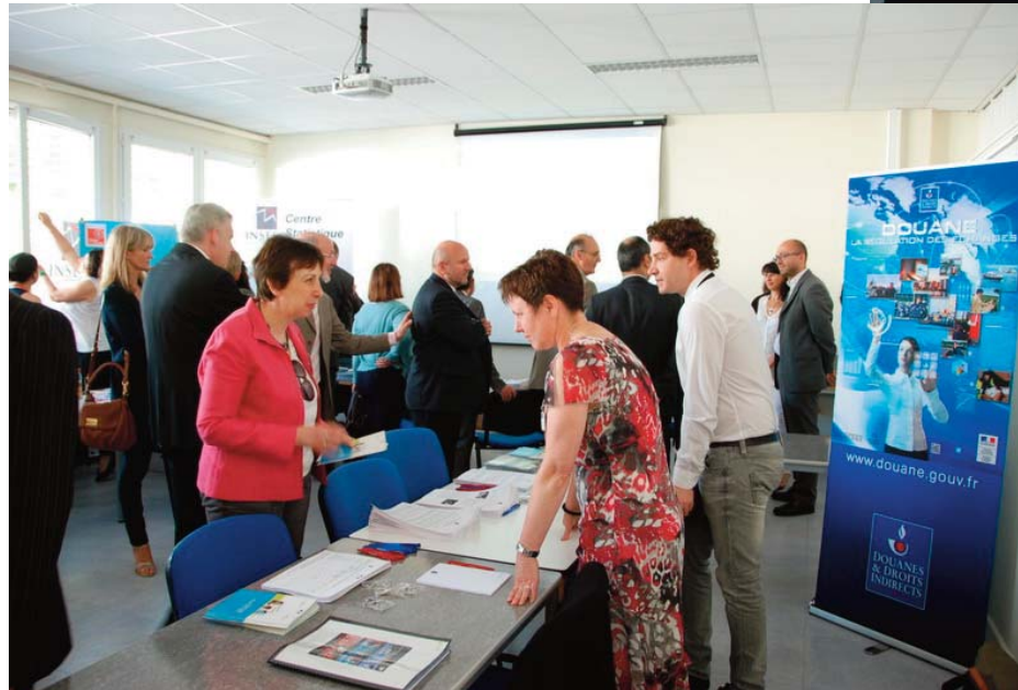
Sur le stand de l'administration des douanes