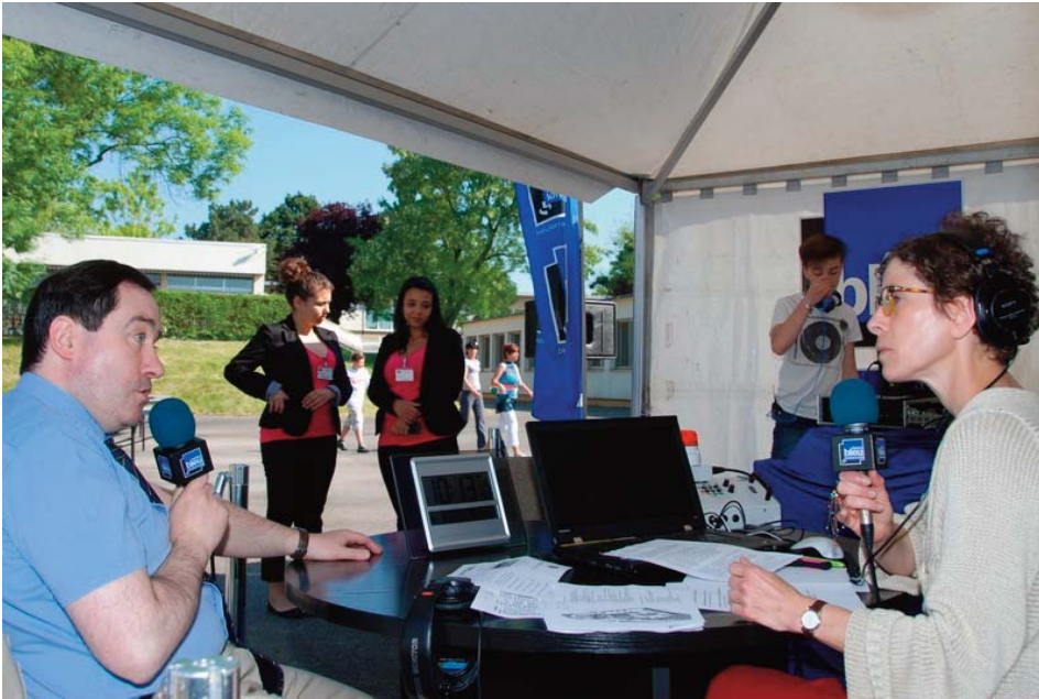
Matinale en direct de France Bleu Lorraine