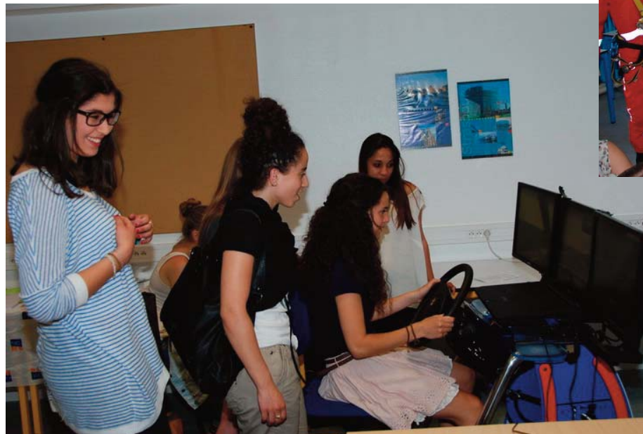
Simulateur de conduite sur le stand de la GMF