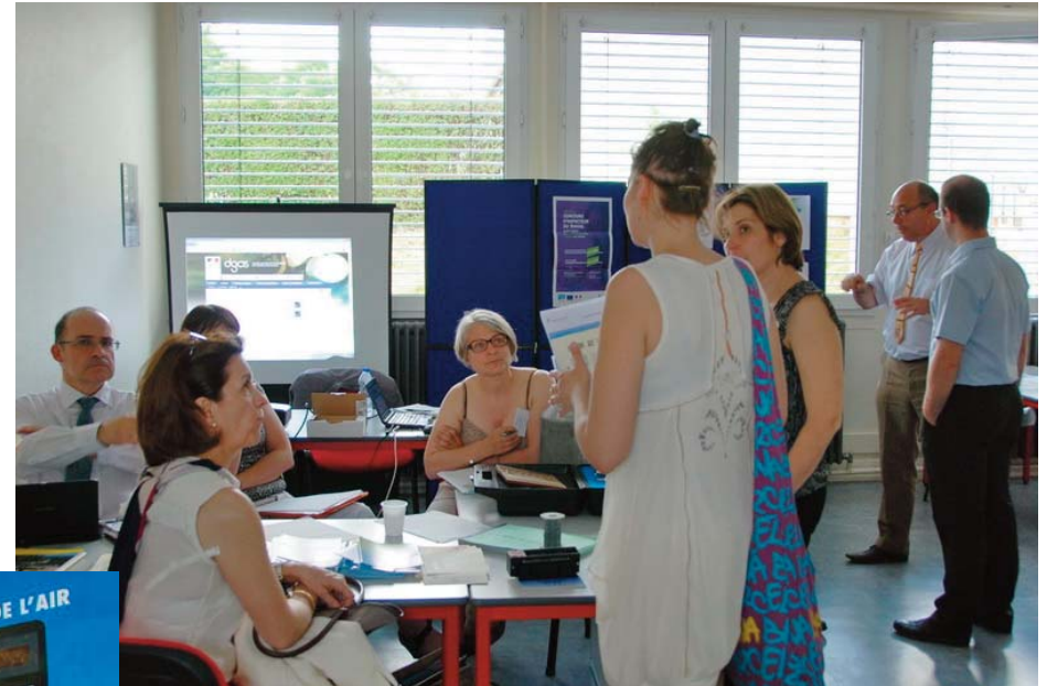
Sur le stand de la DIRECCTE