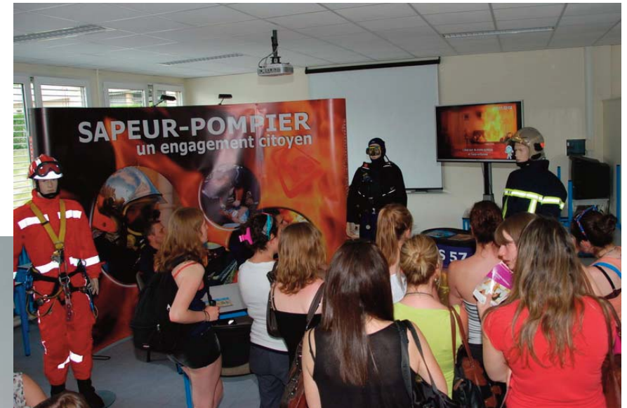
Sur le stand du SDIS57