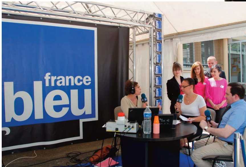
Studio France Bleu Lorraine