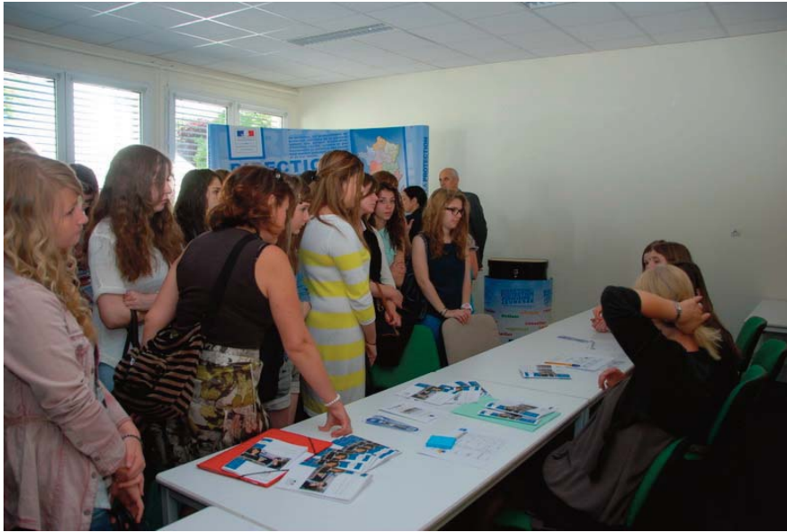
Sur les stands du ministère de la justice