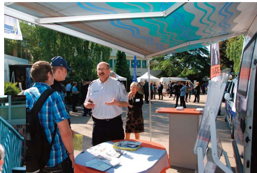
Sur le stand de la police nationale

700 métiers pour représenter les trois fonctions publiques, plus de 1 200 visiteurs en deux jours : le 1er salon de l'emploi et des métiers de la fonction publique organisé par l'IRA de Metz, les 7 et 8 juin 2013, a tenu ses promesses.