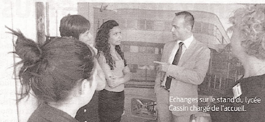
Echanges sur le stand du lycée Cassin chargé de l'accueil.