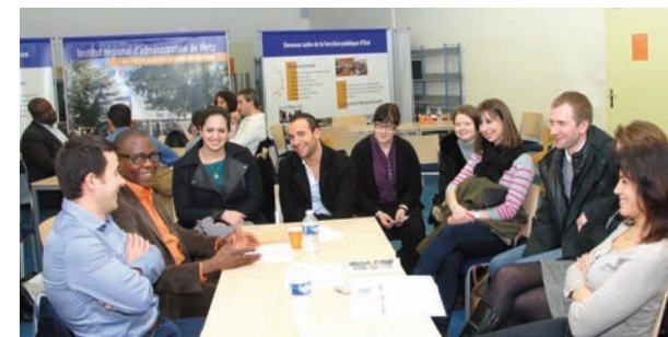
Journée des métiers : présentation des métiers d'attachés aux élèves de l'IRA en formation initiale