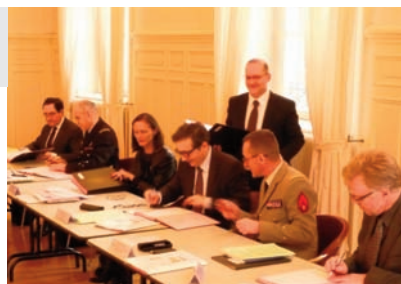
Signature de l'élargissement du trinôme académique

Participation à des actions en faveur des riverains du quartier de Bellecroix, où est situé l'IRA de Metz (partenariat administratif avec le club de football, accueil d'actions de sensibilisation des familles à une consommation et une alimentation responsables...).