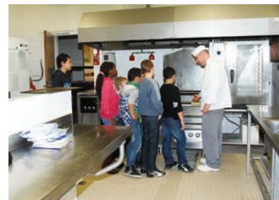
Opération «les marmites de Restaurabelle»