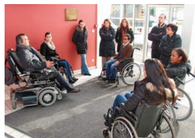
Ateliers pratiques lors des formations