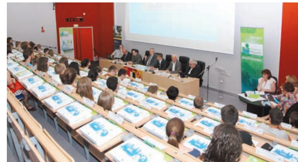
Séance du Conseil général junior de la Moselle à l'IRA

Accueil à l'IRA de collégiens, de séances plénières du Conseil municipal des enfants de la ville de Metz et du Conseil général Junior de la Moselle au cours desquelles les représentants des grandes institutions publiques ont pu présenter leurs métiers et univers professionnels.