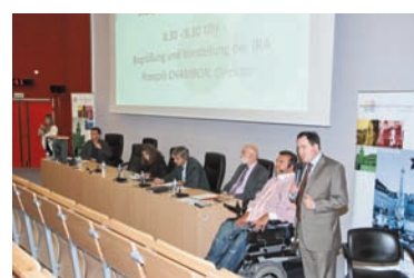
8 ème biennale du handicap