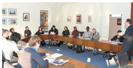
Accueil d'un groupe de jeunes suivis par la mission locale de Metz