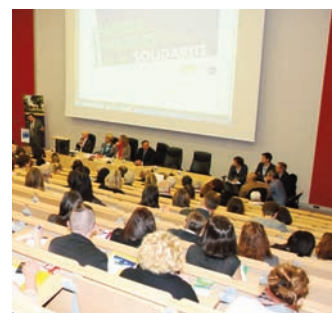
Assises de la solidarité