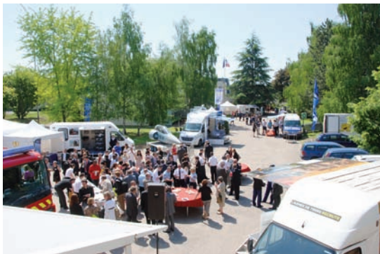
Salon de l'emploi

1 200 visiteurs ont été accueillis sur le site de l'IRA pendant les deux journées du salon.