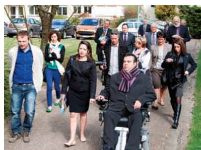
Cheminement extérieur de l'IRA

Des travaux successifs, validés par une attestation d'accessibilité, ont permis de rendre totalement accessibles les locaux de l'IRA de Metz. Un cheminement extérieur, des rampes d'accès et un ascenseur permettent aux personnes à mobilité réduite d'accéder en fauteuil à l'ensemble des locaux de l'institut. Une boucle magnétique, des balises sonores à l'entrée des bâtiments, une table d'orientation vocale et tactile, des mains courantes et des cheminements podotactiles à destination des personnes malentendantes ou malvoyantes ont complété ces aménagements.