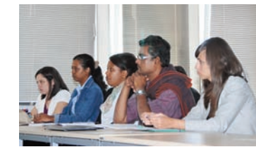
Elèves de la CPI Promotion 2013/14