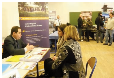
Forum de l'orientation au Lycée Fabert de Metz

Depuis 2010, participation de l'IRA de Metz à plus de 80 forums et réunions d'information dans des lycées, universités et salons de l'orientation.