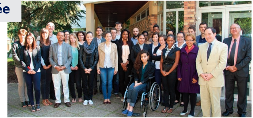
CPI de Metz - Promotion 2014/15

Depuis 2012, un partenariat avec l'Agence de l'outre-mer pour la mobilité (LADOM) a déjà permis à 24 élèves ultra-marins (Réunion, Martinique, Guadeloupe, Guyane) de profiter du dispositif de la CPI pour préparer les concours de l'IRA.