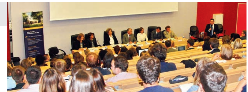
Jury de scolarité 2015-2016