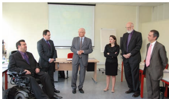
Signature de la convention avec la ville de Metz