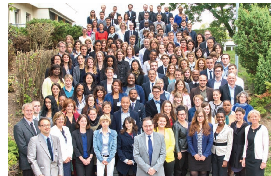
Les élèves de la promotion «Geneviève de Gaulle Anthoinoz» et l'équipe de direction de l'IRA