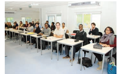
CPI Promotion 2015/16

Depuis 2009, la CPI de l'IRA de Metz a accueilli 164 élèves, 74 ont été admissibles aux concours de l'IRA, 51 ont été admis dans un IRA, et 19 ont réussi un autre concours